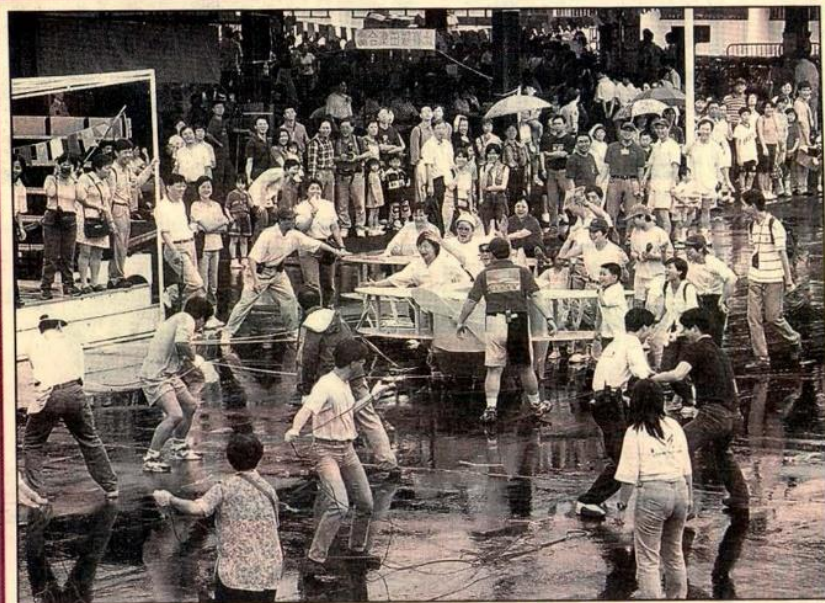
視障人士與一班青年義工合作，盡情投入拉動模型飛機比賽。東方日報 18/10/98 (記者蕭毅攝)