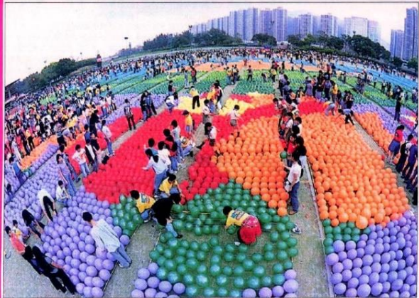
集合三千名年輕人合力，才能完成這幅由氣球組成的大圖畫。